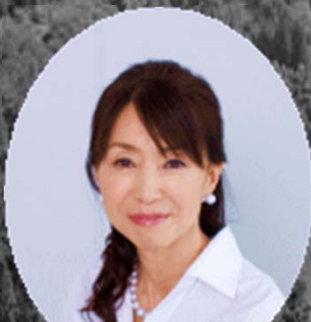
〔作家〕 玉岡かおる氏